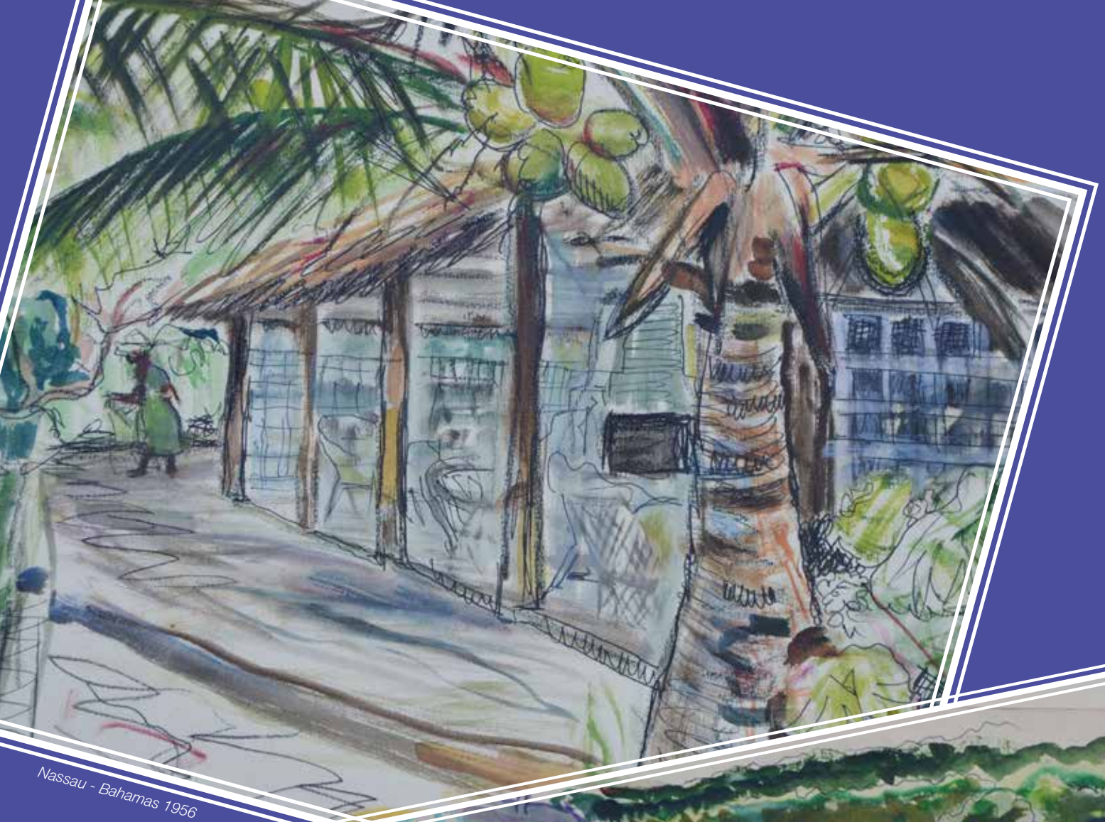
Nassau - Bahamas 1956