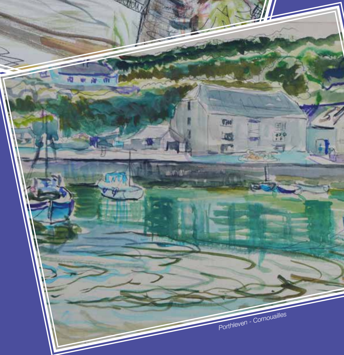
Porthleven - Cornouailles

Vente aux enchères le lundi 23 octobre 2017 à 13h30 à Drouot (salle 14). Expositions publiques (salle 14) : Samedi 21 et Dimanche 22 octobre de 11h à 18h, Lundi 23 octobre de 11h à 12h Renseignements : www.prouvotartpatrimoine.com - www.anak-tnk.org