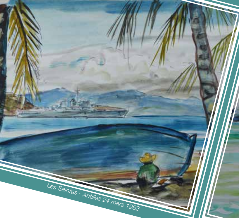
Les Saintes - Antilles 24 mars 1962