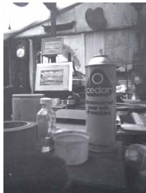
Atelier de Philippe Dauchez rue Mouffetard

Bourlingueur des mers, il a couru des centaines de régates, des dizaines de croisières à la voile et a traversé sept ou huit fois l'Atlantique. Ses voyages ont donné lieu à des centaines d'aquarelles, un butin éclatant d'images, d'études de mers et